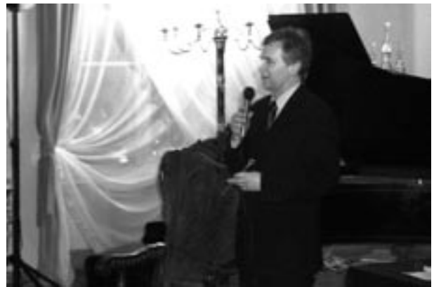
Uroczystość stulecia Muzeum Historycznego, sala Fontany, Pałac „Krzysztofor”, przemawia prezydent Krakowa A. Gołaś