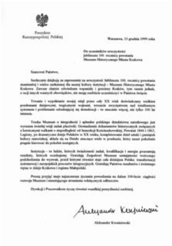
List gratulacyjny od prezydenta RP A. Kwaśniewskiego